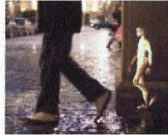
Des marionnettes à découvrir le 20 mars à 20h au Manège de Reims.

« 15 fois l'horizon » nous présente « la vie projetée des marionnettes » ; cette installation-spectacle en plein air est réalisée par les élèves de la 8e promotion de l'ESNAM (École Nationale Supérieure des Arts de la Marionnette). Ainsi, la marionnette va vers de nouveaux horizons car elle sort de son contexte habituel en investissant l'espace urbain. Le 17 mars à 20h à Charleville à l'Institut de la Marionnette (reprise le 19 septembre) ; le 18 mars à 20h à Langres, place Jean Duvert ; le 19 mars à 20h à Sainte-Savine, sur le parvis de la salle de spectacle et le 20 mars à 20h au Manège de Reims.