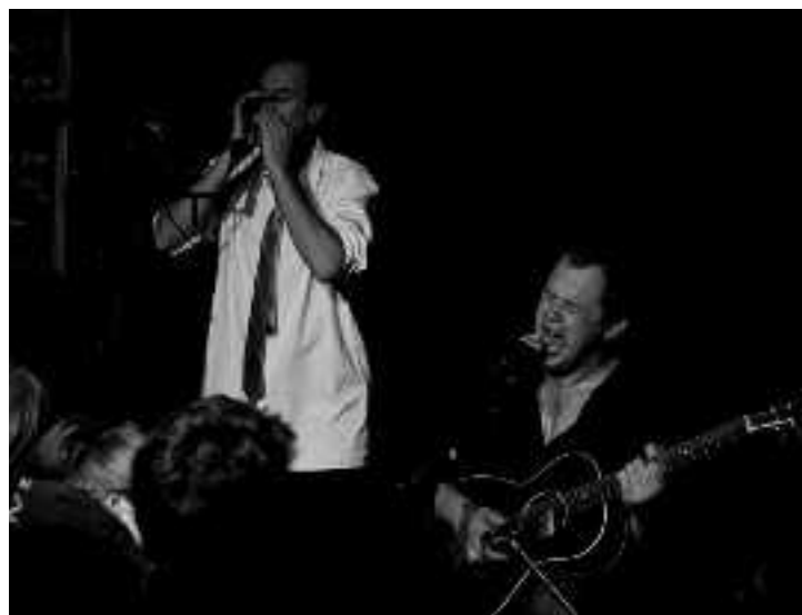
Le concert des Moutain Men a connu un beau succès.

Des surprises comme celles-là, les programmeurs de la RDJ en ont beaucoup d'autres pour cette année. Toujours à l'affût de l'actualité musicale, ils ont le nez creux. On se souvient qu'ils avaient programmé Anaïs juste avant qu'elle n'explose. La saison est toujours orientée chanson française, mais s'ouvre plus aux musiques actuelles, notamment rock. Pour la chanson française, on retrouvera Lherbe folle, les Ptit' Nassels et, surtout, l'indémoudable et inusable Graeme Allwright qui fera deux concerts, dont l'un au